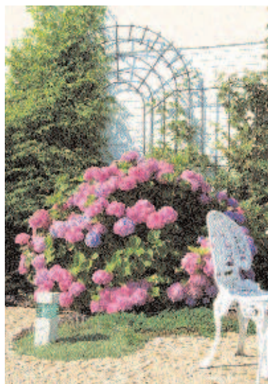
Mała fontanna z kamienia młyńskiego wśród jasnych otoczeków

Wiosennym akcentem są różowe kwiaty tawuły japońskiej. Później rozwijają się fioletowy różanecznik i bujne kwiatostany hortensji ogrodowej. Wczesną jesienią patio rozwesela fioletowy łan astrów. Uzupełnieniem roślinności na rabatach są jednoroczne rośliny w terakotowych donicach na tarasie. Znakomicie będą się tu czuły kolorowe pelargonie, przypołudniki ( Doranthus ), nemezje, portulaki... ■