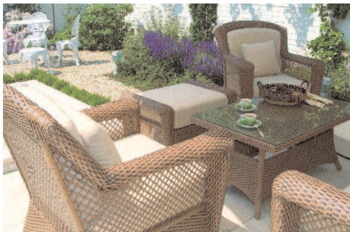
Na tarasie ustawiono okazałe meble z rattanu, na placyku – finezyjne z żeliwa