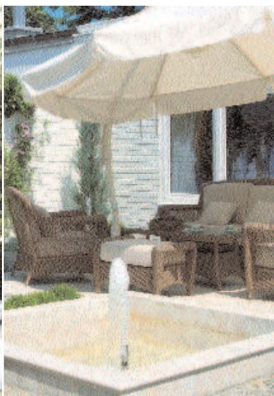
Mała fontanna z kamienia młyńskiego wśród jasnych otoczeków